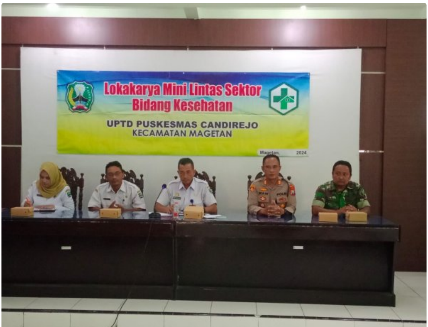
Bati TUUD Koramil 0804/01 Magetan Hadiri Loka Karya Mini Lintas Sektor Tri Bulanan Bidang Kesehatan