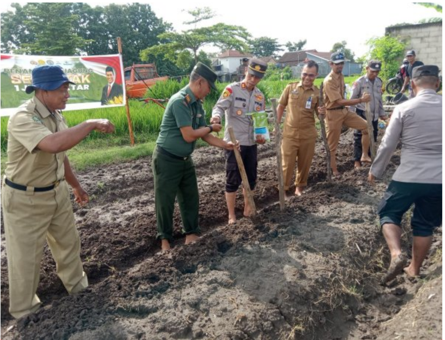
Bersinergi Danramil 0804/11 Takeran Bersama Kapolsek Dalam Kegiatan Penanaman Jagung

Magetan. Forkopimca bersama Anggota dan Dinas Pertanian melakukan penanaman benih jagung dilahan aset Polres Magetan. Bertempat di Dukuh