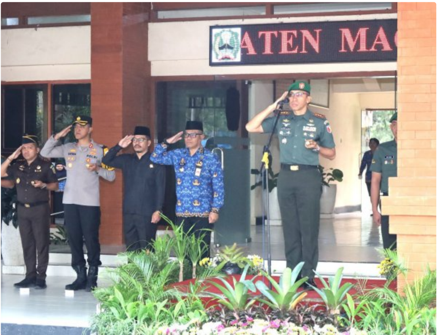
Dandim 0804/Magetan Pimpin Upacara Peringatan Bela Negara Ke-76 Tahun 2024